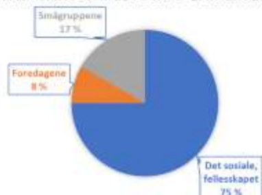
HVA VAR DET BESTE MED SAMLINGEN?